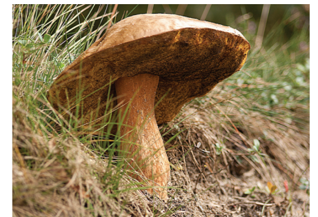
Efterår – Broget Rorhat Kan sammen med mange andre spiselige svampe især findes i skoven vest for hovedvej 11 (posterne 36, 38, 45, 63 og 65)