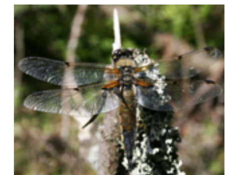
Sommer – Guldsmed (Vandrellibel) Kan sammen med mange andre smukke insekter ses omkring søen og vådområderne syd for post 5 og 9.