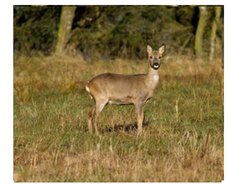
Forår – Rådyr Kan sammen med kronstyr især ses ved de vestligste poster 42, 47 og 48.