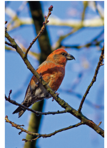
Vinter – Korsnøb (han) Området har et rigt fugleliv hele året. Dette billede er taget i området ved Naturcenteret (post 6 og Start 1)